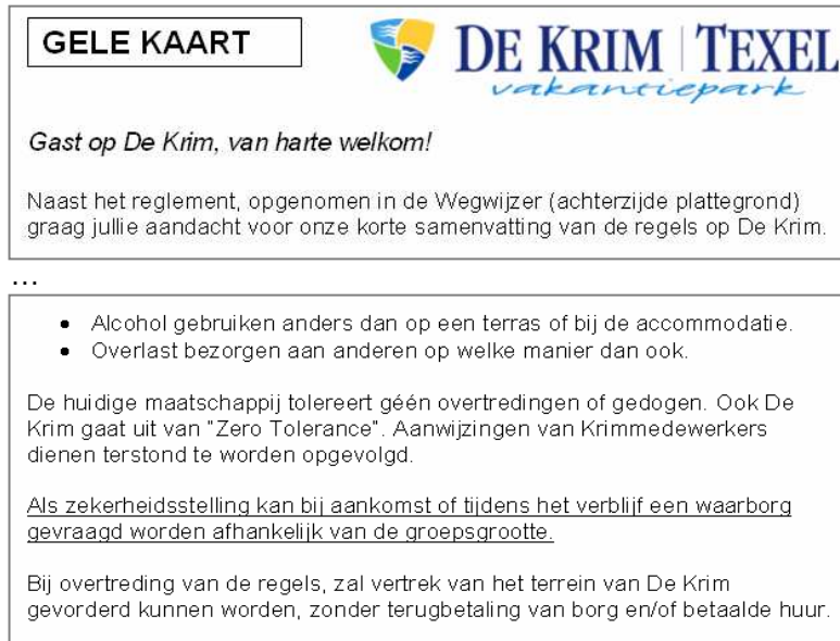
Figuur 2: Fragmenten van de 'gele kaart' van camping De Krim te Texel

Hierbij reikt de camping een zogenaamde 'gele kaart' uit (zie figuur 2). Hierop staan de belangrijkste regels voor jongeren op de camping nog eens kort uitgelegd. Een medewerker van de camping bezoekt de jongeren heel bewust persoonlijk op hun standplek. Voor de jongeren is dit een teken dat de camping goed overzicht houdt. Voor de camping is dit een manier om de jongeren beter in te kunnen schatten en ze nog eens te herinneren aan de regels en om een goed overzicht te houden waar op de camping welke jongeren kamperen. Ook probeert de camping overlast te beperken door een persoonlijke verstandhouding met de jongeren te creëren.