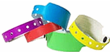
Figuur 3: Polsbandjes die op feesten gebruikt worden

Campings hanteren verschillende initiatieven om leeftijdsgrenzen bij alcoholverkoop goed na te leven. Een persoonlijke campingpas voor jongeren (met foto en geboortedatum) is hier een voorbeeld van. Camping Jagerstee in Epe heeft dit systematisch doorgevoerd. Alle jongeren op de camping beschikken over een pas die ze altijd bij zich moeten hebben. Aan de hand van deze pas kan te allen tijde worden gecontroleerd op leeftijd. Op deze camping vinden ook gescheiden discoavonden voor verschillende leeftijden plaats. Alleen bij de 16+ discoavonden wordt alcohol geschonken. Het organiseren van gescheiden feesten voor 16+ en 16- is een goede oplossing voor de naleving van leeftijdsgrenzen. Op deze manier worden jongeren onder de 16 ook niet geconfronteerd met alcoholgebruik.