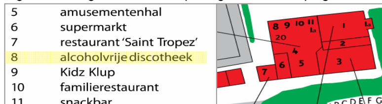
Figuur 4: Een gedeelte van de plattegrond van camping Riviera te Biddinghuizen

Op sommige campings worden tijdens feesten bandjes uitgereikt (zie figuur 3); jongeren boven de 16 krijgen bij binnenkomst een andere kleur polsbandje dan jongeren onder de 16. Echter de beste en meest effectieve oplossing lijkt toch wel de alcoholvrije discotheek. Camping Riviera in Biddinghuizen geeft aan: “Ik vind deze oplossing niet meer dat logisch aangezien het merendeel van de jongeren op de camping onder de 18 is.” Deze camping laat zien dat er prima discoavonden kunnen worden georganiseerd zonder dat er alcohol aanwezig is.